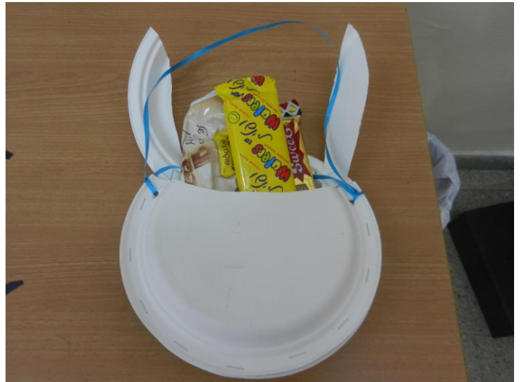
פסיה קלרמן והילרי הרצברגר