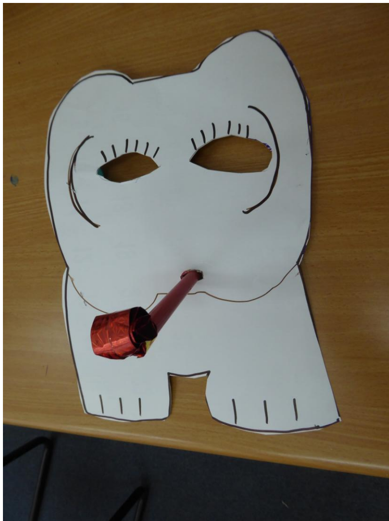
הילרי הרצברגר, עריכה: פסיה קלרמן