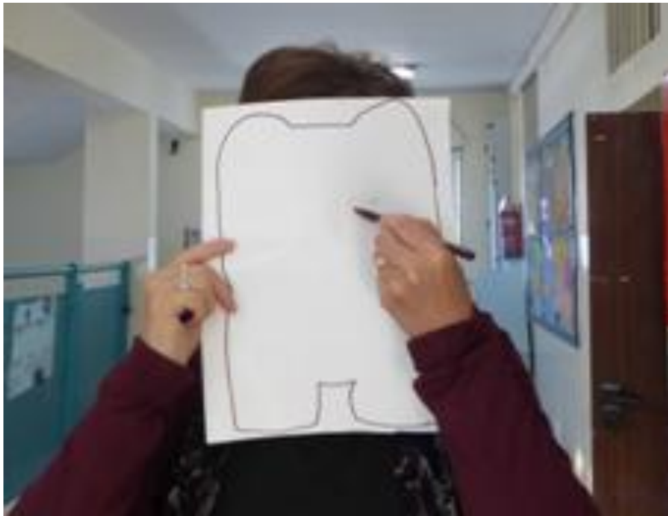
הילרי הרצברגר, עריכה: פסיה קלרמן