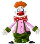
הליצן שמתלבש מוזר